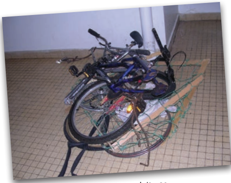
Le loca vélo ne doit pas servir à déposer des encombrants