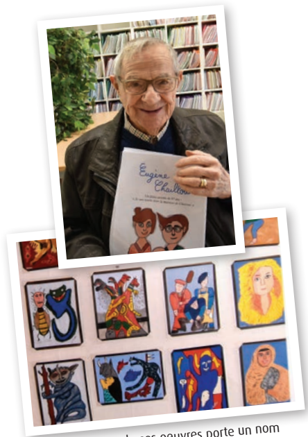
Chacune de ses œuvres porte un nom