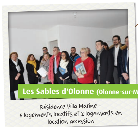
Résidence Villa Marine - 6 logements locatifs et 2 logements en location accession