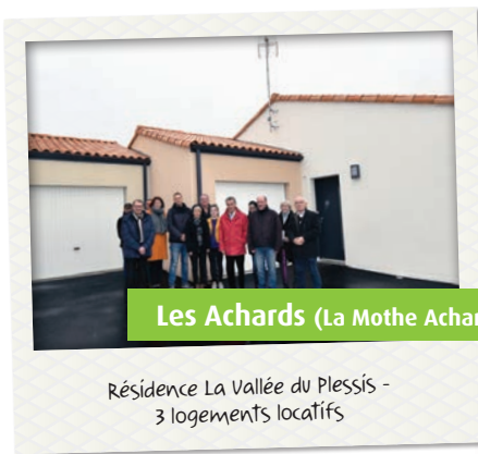
Résidence La Vallée du Plessis - 3 logements locatifs