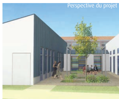
Perspective du projet