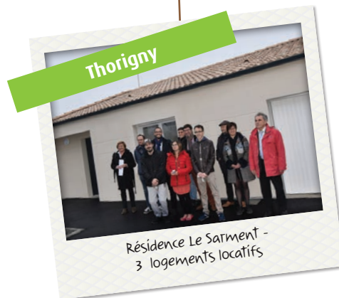
Résidence Le Sarment - 3 logements locatifs