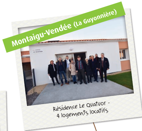
Résidence Le Quatuor - 4 logements locatifs

Au 31 mars 2019, l'office compte un patrimoine de 15 040 logements locatifs sur le département de la Vendée.