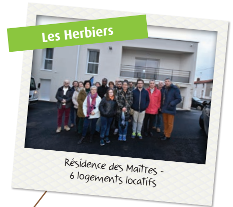
Résidence des Maîtres - 6 logements locatifs