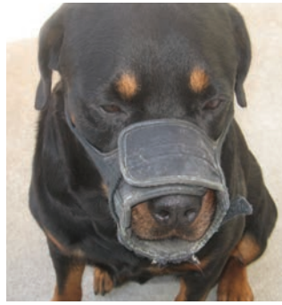
Pour vos animaux, pensez à vous référer au règlement intérieur et à le respecter