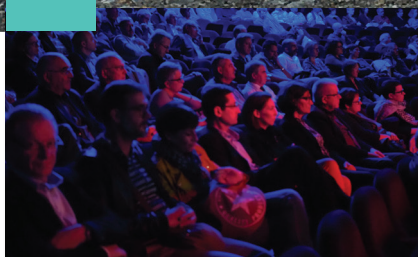
ZOOM SUP... Retour sur le 15 000 ème logement P. 4