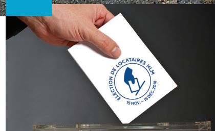
DE VOUS À NOUS Élections des représentants des locataires P. 7