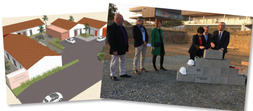
Pose de la première pierre des 7 logements en maintien à domicile aux Herbiers