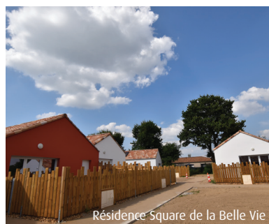
Résidence Square de la Belle Vie