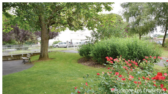
Résidence Les Croisettes

Avec cette opération, Vendée Habitat livre son 10 ème Pôle Santé.