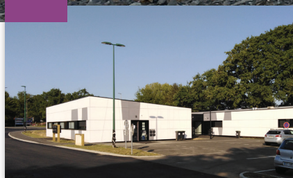
QUOI DE NEUF Inauguration du Pôle Santé de Moulleron-le-Captif P. 2

Le 19 octobre dernier, la première pierre de 7 logements pour le maintien à domicile des personnes âgées a été posée aux Herbiers. Elle a lancé la manifestation organisée pour notre 15 000 ème logement locatifs.