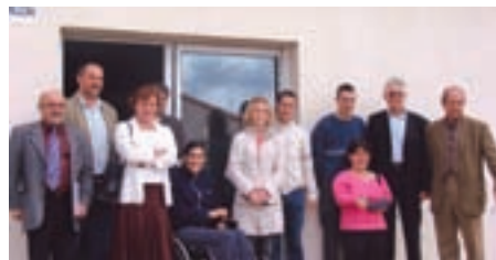
Résidence "Le Clos de L'Aiguillon"

La remise de clés de 3 logements de type 3 et 4, Résidence Le Clos de L'Aiguillon, s'est déroulée le 24 mai dernier. Une des maisons est spécifiquement aménagée pour des personnes à mobilité réduite. ■