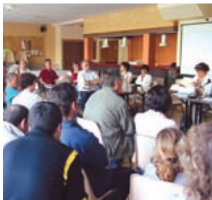
Une assemblée attentive à la présentation des travaux