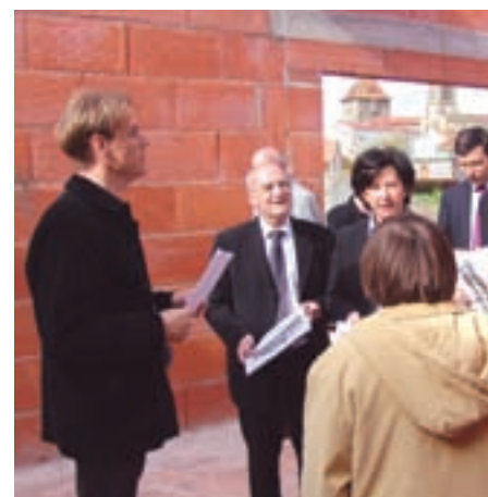
Elus et partenaires ont visité le chantier le 20 avril

La commune abritera prochainement un Service d'Accompagnement à la Vie Sociale dédié aux jeunes adultes handicapés. Né d'un partenariat soutenu entre les familles, le futur gestionnaire « Les Papillons Blancs », les services du Conseil général et l'Office en qualité de propriétaire, l'établissement permettra la prise en charge de 13 personnes, dont 6 habiteront sur place dans des logements individuels. ■