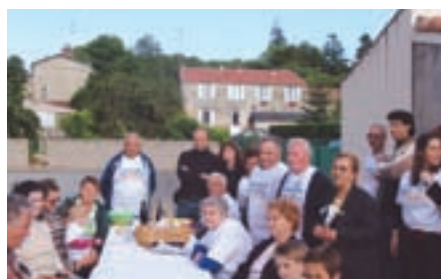
La Pommerai Sablière, Fontenay-Le-Comte