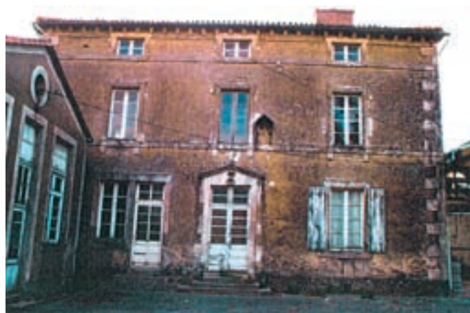
Ancienne école désaffectée à Saint-Pierre-du-Chemin...

en-Pareds, La Réorthe, Sainte-Hermine, Brem-sur-Mer et Bournezeau. Malgré un investissement financier plus important que celui des constructions neuves, l'OPDHLM tient à poursuivre ces programmes qui représentent une solution efficace pour éviter que des bâtiments ne soient laissés à l'abandon. En outre, les communes font un effort de leur côté en cédant gratuitement les propriétés à rénover ou en signant un bail de longue durée. ■