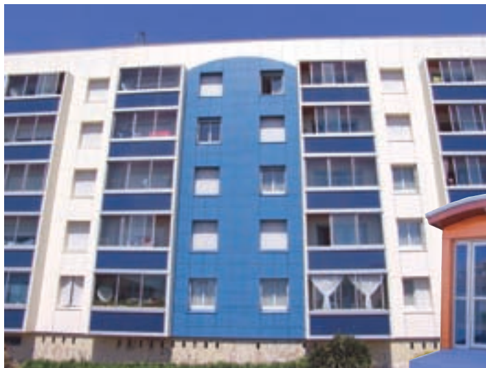
Isolation extérieure renforcée