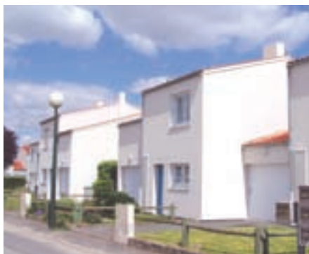
Le Patis du Moulin rénové

Une réunion de concertation a été organisée le 1er juin réunissant les locataires, les élus de la commune et les services de l'Office, afin de présenter les travaux de réhabilitation qui seront réalisés pour les 58 logements. Cette rencontre fut aussi l'occasion pour les résidents de s'exprimer sur les améliorations souhaitées parmi les options proposées en plus de ce qui est déjà programmé. ■