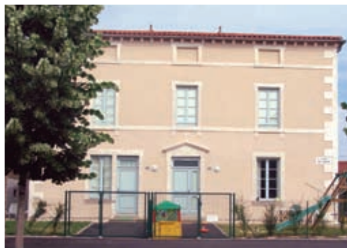
...réhabilitée en logements par l'office