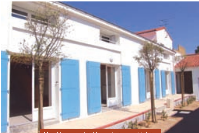
Murs blancs et volets bleus créent une unité de ton