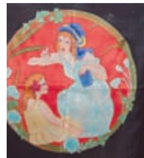
la soie est sa matière préférée