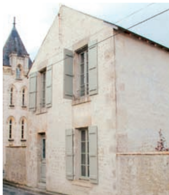
...Un bâtiment embelli au cœur de la ville