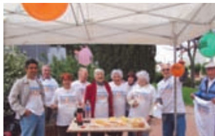
La Liberté, La Roche sur Yon