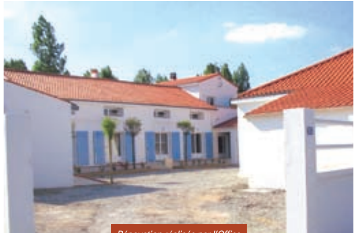
Rénovation réalisée par l'Office