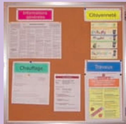
Une meilleure lisibilité des informations

Afin d'améliorer la lisibilité des informations affichées dans les entrées d'immeubles, l'Office procède à une classification des éléments par catégories. Les panneaux d'affichage intègrent désormais des informations permanentes, comme le règlement intérieur et les coordonnées de vos contacts à l'Office. Des informations ponctuelles sur les travaux, le chauffage, etc. viennent compléter la nouvelle signalétique. ■