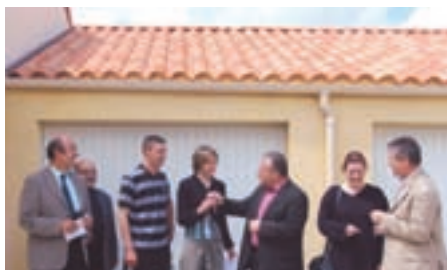
Résidence "Le Hameau des Noisetiers"