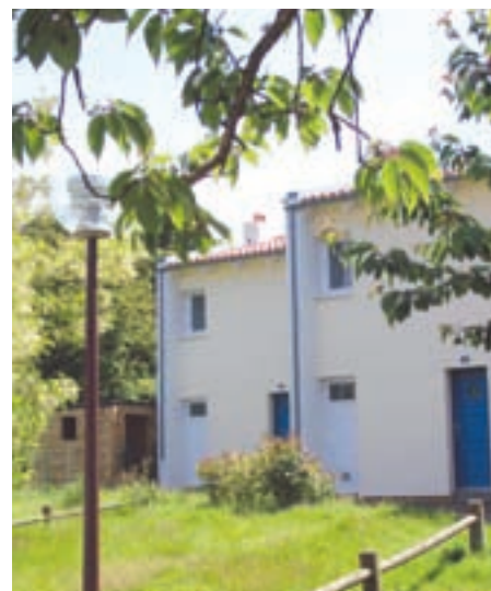
Travaux réalisés sur 19 logements

A l'intérieur des logements la pose de sols en PVC, l'installation d'une ventilation, la réfection des sanitaires et la mise aux normes de l'électricité complètent les améliorations apportées. ■