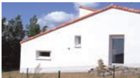
Résidence "La Coutère"