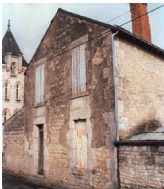
Rue des Tanneurs à Fontenay, avant acquisition...