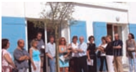
Résidence de "L'Ecole"