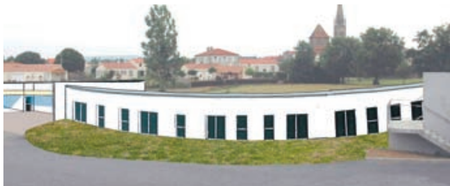
L'Office assure la maîtrise d'ouvrage de l'établissement

La commune abritera prochainement un Service d'Accompagnement à la Vie Sociale dédié aux jeunes adultes handicapés. Né d'un partenariat soutenu entre les familles, le futur gestionnaire « Les Papillons Blancs », les services du Conseil général et l'Office en qualité de propriétaire, l'établissement permettra la prise en charge de 13 personnes, dont 6 habiteront sur place dans des logements individuels. ■