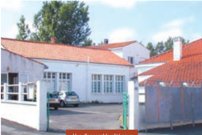
Vue d'ensemble côté cour