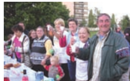
La Demoiselle, Les Herbiers