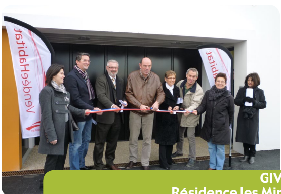
GIVRAND Résidence les Mimosas 5 logements