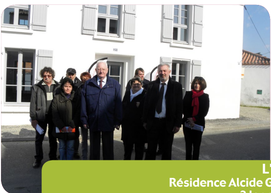
L'ÉPINE Résidence Alcide Garriou 3 logements