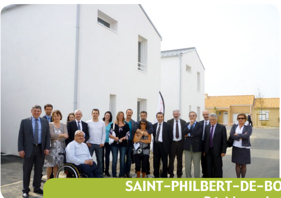
SAINT-PHILBERT-DE-BOUAINÉ Résidence Les Alizés 3 logements et 4 pavillons en location accession