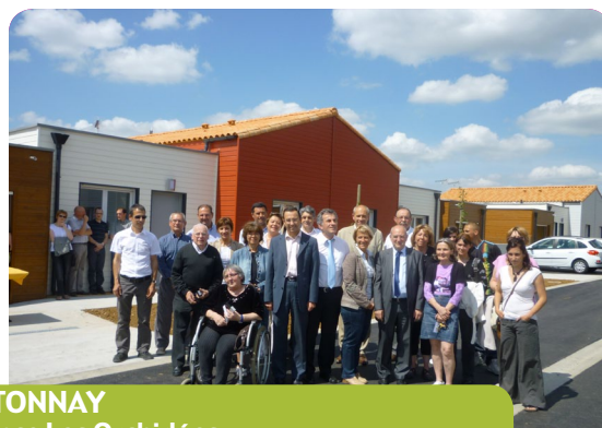
CHANTONNAY Résidence Les Orchidées 13 logements modulaires bois