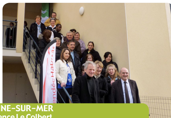
OLONNE-SUR-MER Résidence Le Colbert 6 logements