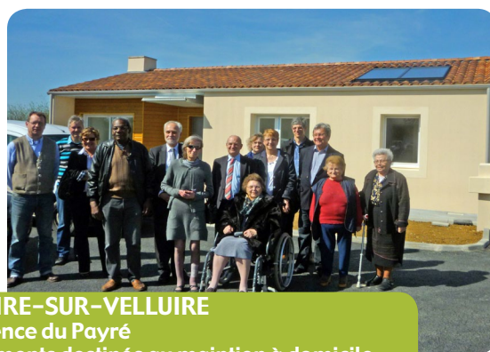
LE POIRE-SUR-VELLUIRE Résidence du Payré 6 logements destinés au maintien à domicile