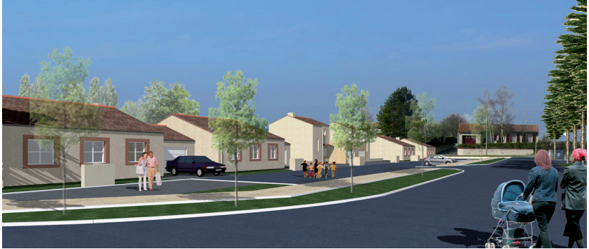
Plan d'un logement