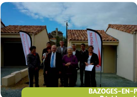
BAZOGES-EN-PAREDS Résidence le Loing 4 logements en maintien à domicile