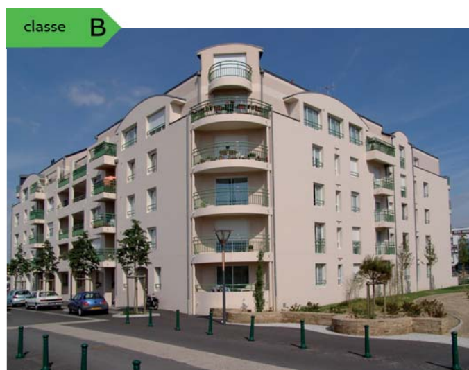
Résidence Les Mulons aux Sables d'Olonne