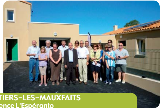
MOUTIERS-LES-MAUXFAITS Résidence L'Espéranto 4 logements