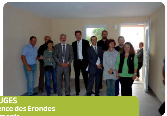
TIFFAUGES Résidence des Erondes 4 logements