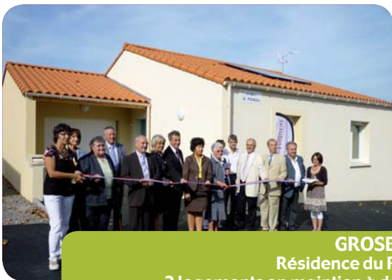
GROSBREUIL Résidence du Poneau 2 logements en maintien à domicile