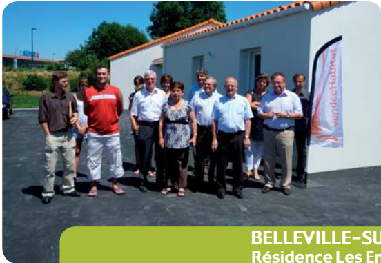
BELLEVILLE-SUR-VIE Résidence Les Embruns 3 logements