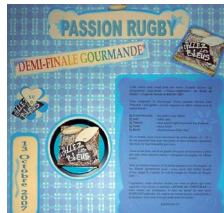
Un page de scrapbooking avec Journaling* *Le Journaling consiste à décrire sur la page de scrapbooking ce que l'on a créé

de sa famille et sous l'œil attentif de son chien Yoda et de son petit chat Booh, se mettre à la peinture sur toile, art qui l'a toujours attirée... « Peut-être à ma retraite ! » conclut-elle. ■