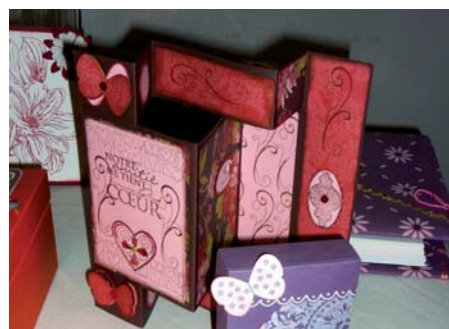
Réalisation de cartes