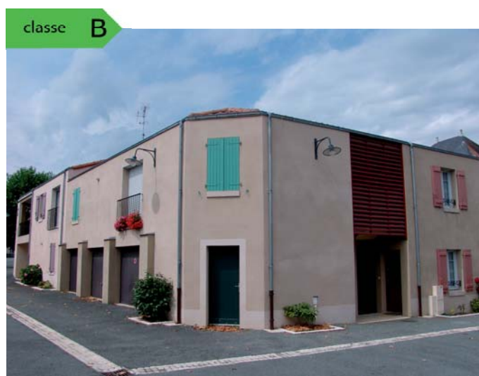
Résidence Tino Bonin à Chantonnay