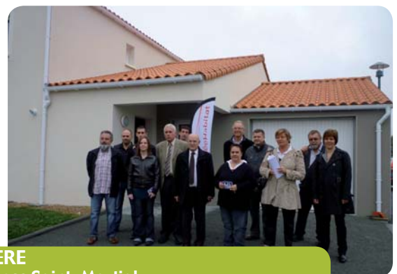
FOUGERE Résidence Saint-Martial 4 logements